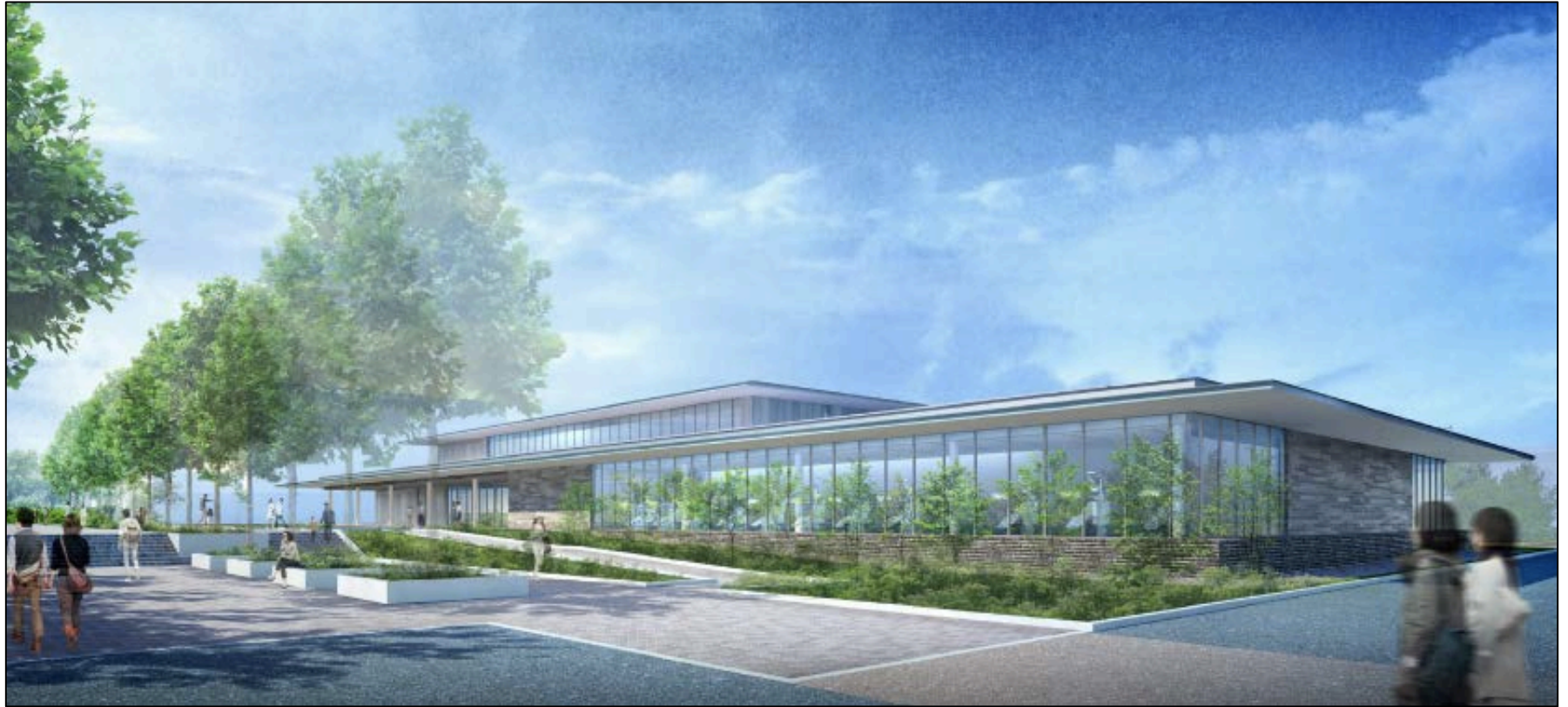
新千葉歯科医療センター完成予想図(イメージ図)