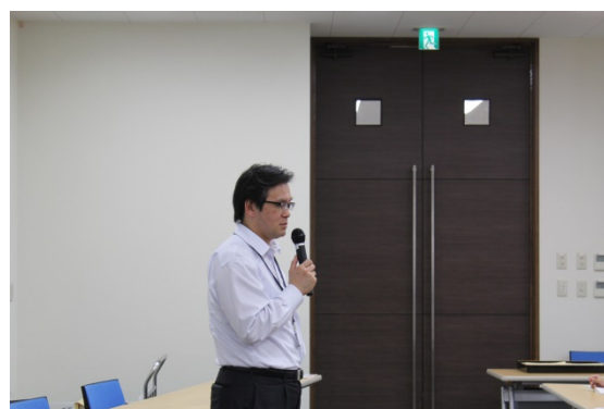
東教務部長による説明