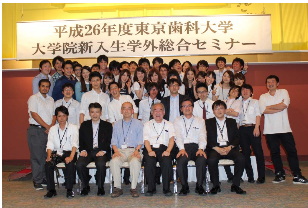
懇親会後に記念撮影