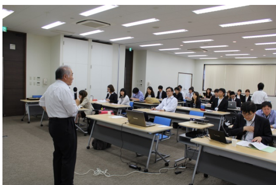
田崎大学院研究科長による開講の挨拶