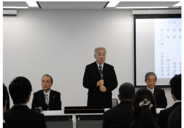
田崎大学院研究科長より挨拶