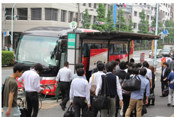
今年は水道橋校舎からバスで御殿場に向けて出発