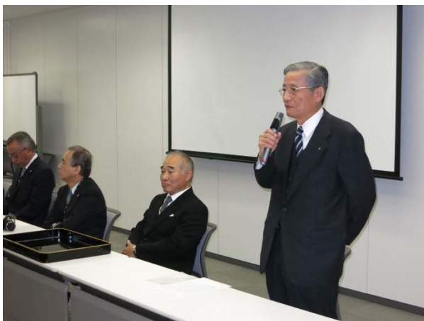
矢崎同窓会長の挨拶