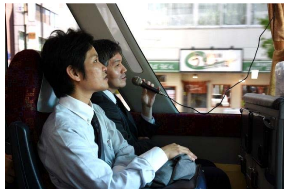
スケジュールについて説明する堂地事務主任