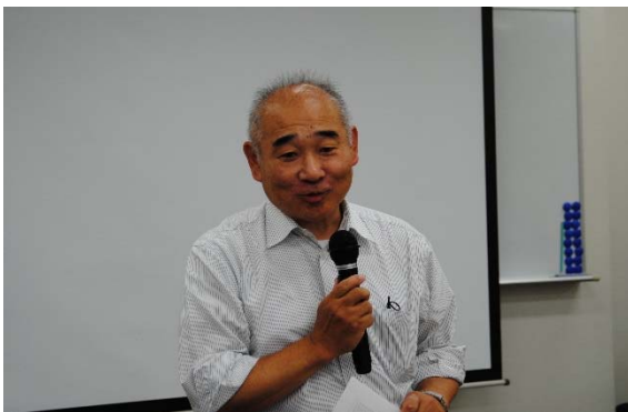
田崎大学院研究科長による開講の挨拶