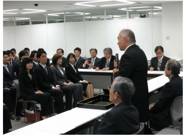
田崎大学院研究科長より挨拶