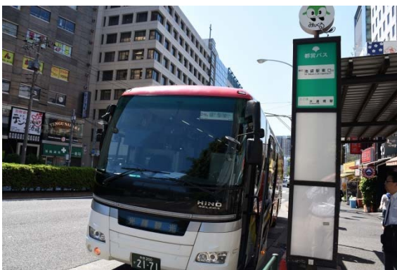
水道橋校舎からバスで御殿場に向けて出発