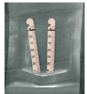
図2: シルマー試験紙

原因が分からず唾液分泌量が減少している場合には、シェーグレン症候群を含む自己免疫疾患が疑われるため、血液検査、シルマーテスト(カラーバーシルマー試験紙:ホワイトメディカル(株)、図2)(基準値:5分後に5～10mm)、口唇生検(基準値:(陽性)1focus/4mm 2 , focus導管周囲に50個以上のリンパ球浸潤を認める、図3)などを行います。